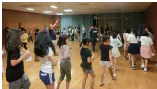
◆ 8 月 1 日 (火) 港南区ひまわり生活体験交流事業への協力