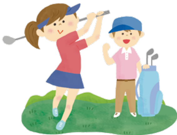
◆ 6 月 16 日 (金) 第 128 回ゴルフコンペ 磯子カンツリークラブ