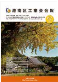
港南区工業会会報 No. 62号発行