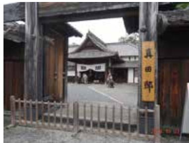
◆10月2日(日)～3日(月) 秋季研修旅行の実施(17名参加) 長野県上田市 真田の里「周辺の歴史をドラマを情景に戦国武者の思いを携えて探訪」