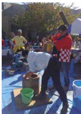
◆11月5日(土) 港南区ひまわり交流会 「子どもゆめワールド」へ参加 模擬店(焼き鳥)を出店し、地域交流を深め、当会のPRも行いました