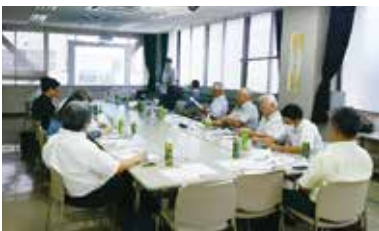
◆9月30日(金) 港南区役所地域振興課との対話会 テーマ「地域に学び、地域へ還元し、地域を活性化させる企業づくり」 (13名参加)