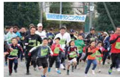
◆1月8日(日) 「港南区健康ランニング大会」へ協賛