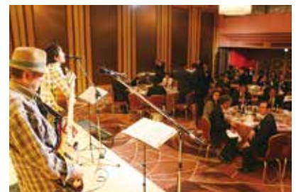
◆1月24日(火) 新年賀詞交換会の開催 (77名参加)