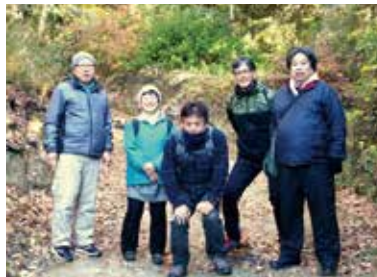
◆12月17日(土) 自然を楽しむ会 金沢の森を歩く 金沢文庫～金沢自然公園 (6名参加)