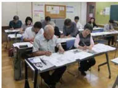
◆10月20日(木) 和道会〈書道〉(12名参加)