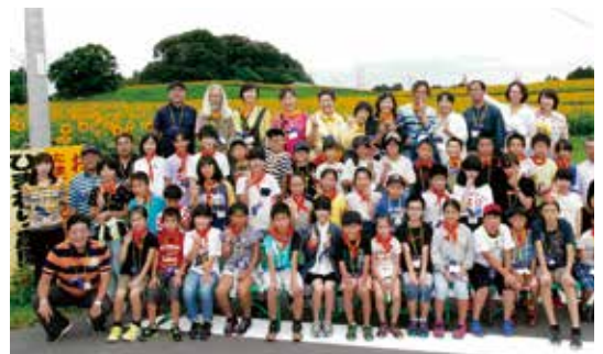
◆8月8日(水) 港南区ひまわり交流事業への協力