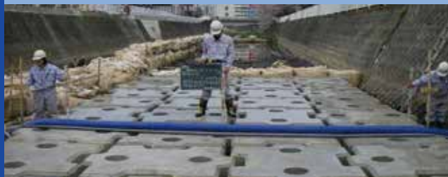
河床洗掘対策工事