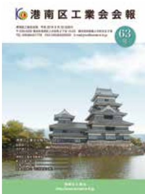
港南区工業会会報 No.63号発行