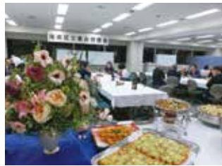
◆5月24日(木) 第37回通常総会・懇親会 ウィリング横浜12階 (68名参加)