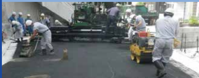
狭あい道路拡幅工事