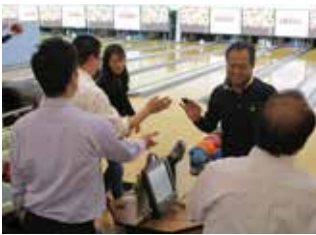
◆3月16日(金) ボウリング大会と懇親会 (13社 40名参加) 「赤い風船ボウリング場」と「和風ダイニング きざみ」