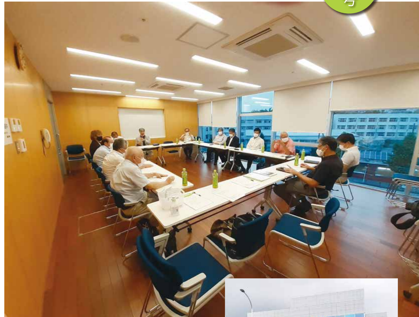
定例理事会の様子。新しくなった港南公会堂会議室にて