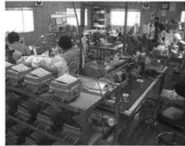
作業の様子。小さな部品を組み立て調整する、根気の要る作業です。

一つ一つの基板が手作業で丁寧に製作されていく様を見て、改めて「モノ」の大切さに気づかされた訪問となりました。