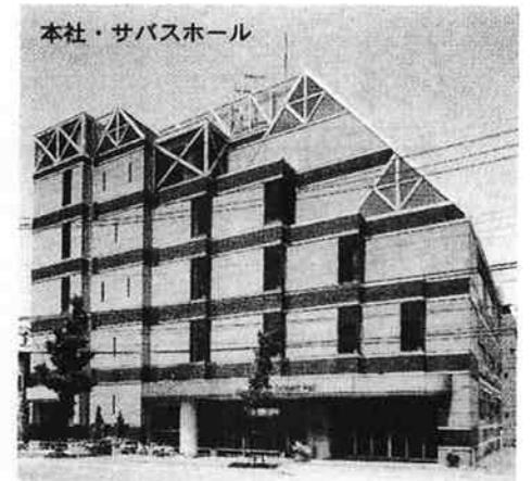
本社・サバスホール

厚生労働省認定一級葬祭ディレクターが葬儀に関するご相談について親切・丁寧にお答えいたします。お気軽にお申しつけください。