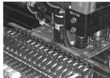
マウンターによる作業。自動で部品の一部を基盤にのせていきます。