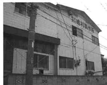
製作所の外観。街の中にある工場には懐かしさを感じます。