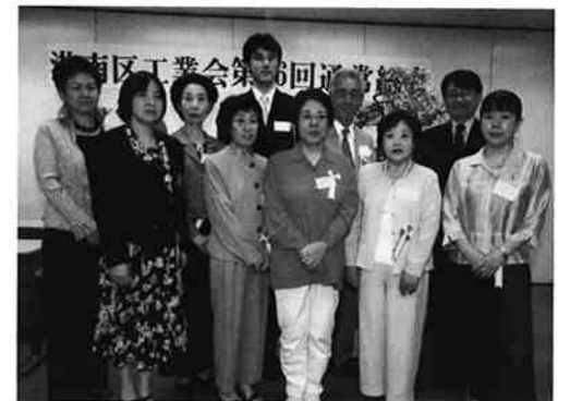
▲会長賞受賞の皆様