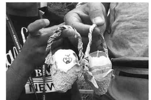
▲廃油とたまごの殻で作ったエコキャンドル

ご提供、株式会社八千代ポトリ様よりたまごのご提供をいただきました。キャンドル点灯の午後8時には、会場に隣接するサンデーサンや港南台タカシマヤも趣旨に賛同してライトオフの協力を行い、200名を超える参加者が、キャンドルの灯火を見つめながらステキな時間を過ごしました。