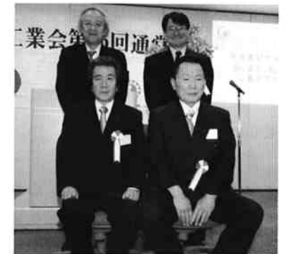
▲市長賞受賞の皆様