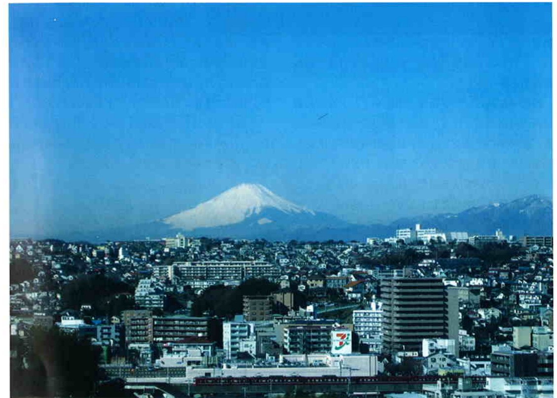
(上大岡小学校から見る富士山)