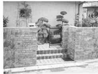
昭和50年代の頃の実績