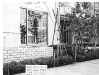
実際に手がけた造園の様子

これを少しでも緩和し、もっとも緑豊かなすばらしい環境の横浜市にしてゆかなければなりません。例えば小面積でも緑化の出来る屋上とか建物の壁面等を利用して少しでも緑を増やす工夫をする必要があると思います。それには行政は勿論のこと市民の一人一人が強い意志を持って取り組んで行かねばならないと感じております。