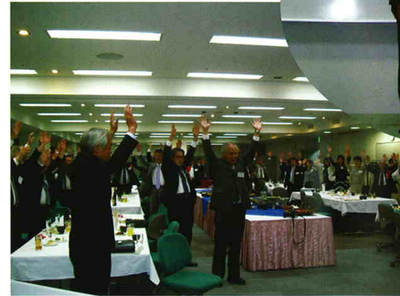
中締めの方歳三唱