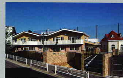
赤い屋根保育園 竣工:2004年10月

次代を担う子どもたちの為に・・・ 「一般的」ではなく「唯一」の施設から生まれる快適さを ご提案させていただきます。