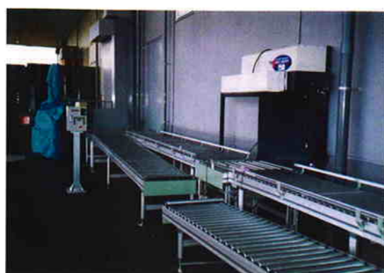
ラインを組み工場全体に配置したFA搬送ライン