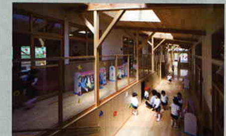
室の木幼稚園 竣工:2006年3月