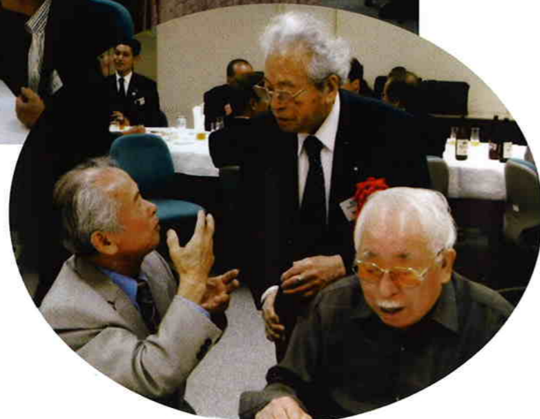
工業会の重鎮です。