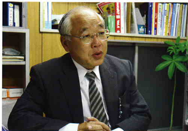
海釣りやゴルフも大好きな橋爪社長