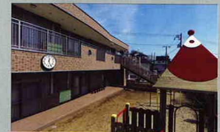
チェリーガーデン保育園 竣工:2009年3月

日程:12月15～17日 場所:横浜赤レンガ倉庫 内容:建築家のパネル展示と無料相談会 自然エネルギー(太陽光・屋上緑化等)の相談会も同時開催