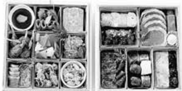
重慶飯店 中華おせち 二程重 ¥31,500 ※一程重 ¥21,000 もご利用しております。(現金・送付可)