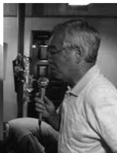
上大岡の遊木里にて