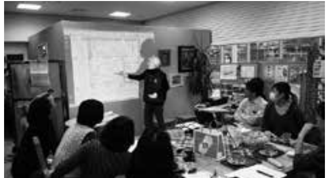
コーヒータイム店内