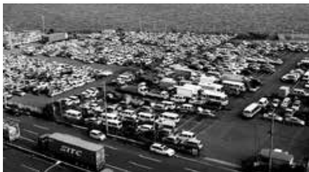
輸出を待つ中古車 (YCC 屋上より)

最後になりましたが、今回の見学会を無料で開催いただきました(社)横浜港振興協会様に御礼申し上げます。